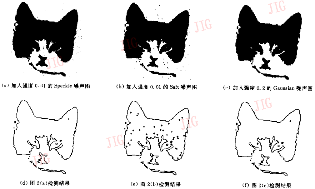
图 2 边缘检测抗噪实验

实验表明,本方法对于 Speckle 和 Gaussian 噪声具有很好的抑制能力,能够滤除噪声.对 Salt 型噪声具有一定的抑制能力,与其他算子检测相比,结果属中上水平.