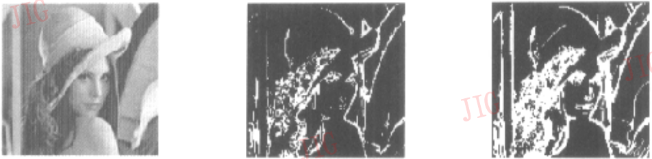
图3 对256级灰度图进行边缘检测实验

测试结果表明,该算法同样适用于灰度图象,并且还可以根据关联度阈值 \theta 的大小,控制待检测的边缘信息量。