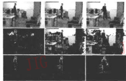
图2 光照突变下,本文算法与传统混合高斯模型的分割结果比较